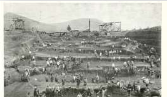
Работа на золотом прииске