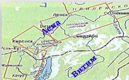
«Компания промышленности» действовавшая на реках Лене и Витим