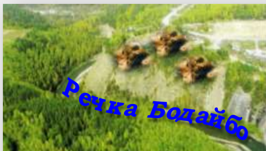
бассейн реки Бодайбо, правый приток р. Накатами